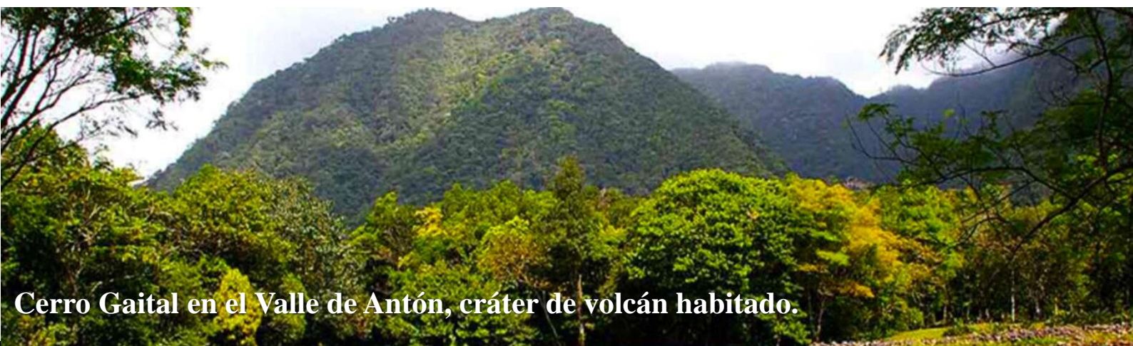
Cerro Gaital en el Valle de Antón, cráter de volcán habitado.

Nos acompañan expositores presenciales de países Iberoamericanos como: España, Portugal, Colombia, México, Costa Rica, Cuba, Guatemala y otros en la modalidad virtual; así como panameños de las diferentes Provincias y Comarcas .